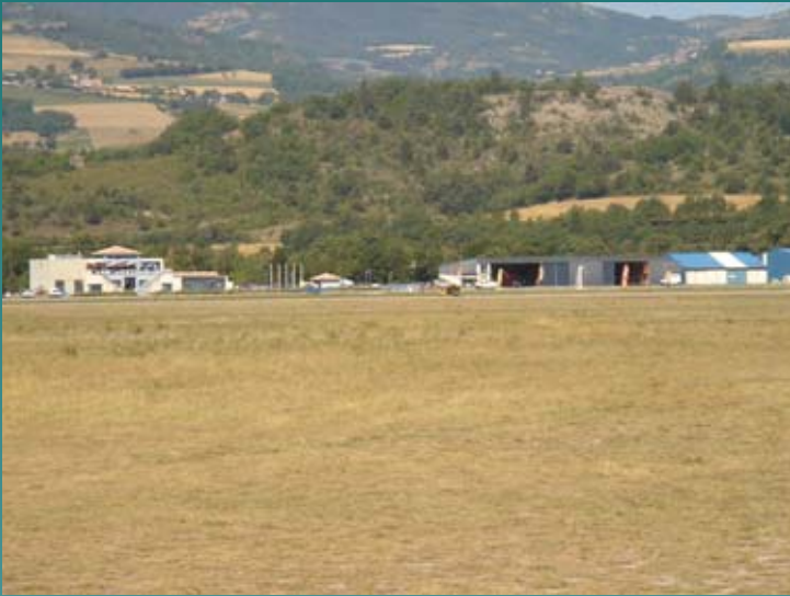
Le restaurant-bar et les hangars